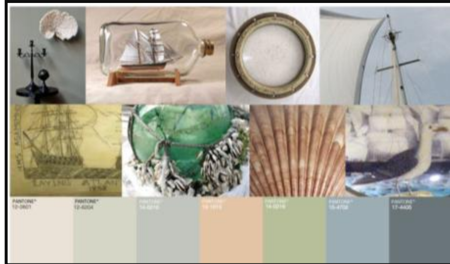
Sumuiset pastellisävyt, siniharmaa, pellava, hiekka, kerma ja pehmeät valkoiset