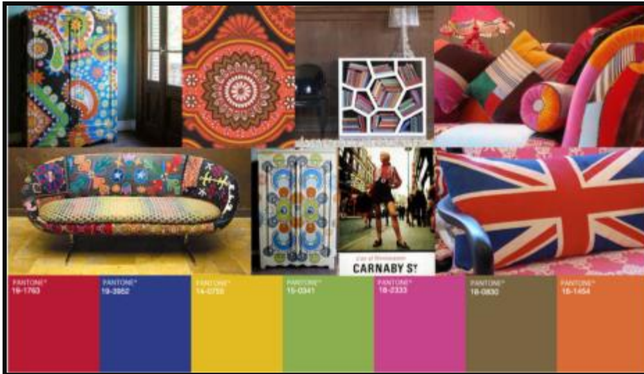
Punainen, sininen, valkoinen ja retrovärit 70-luvulta Sekoitetaan ja yhdistellään, mix&match