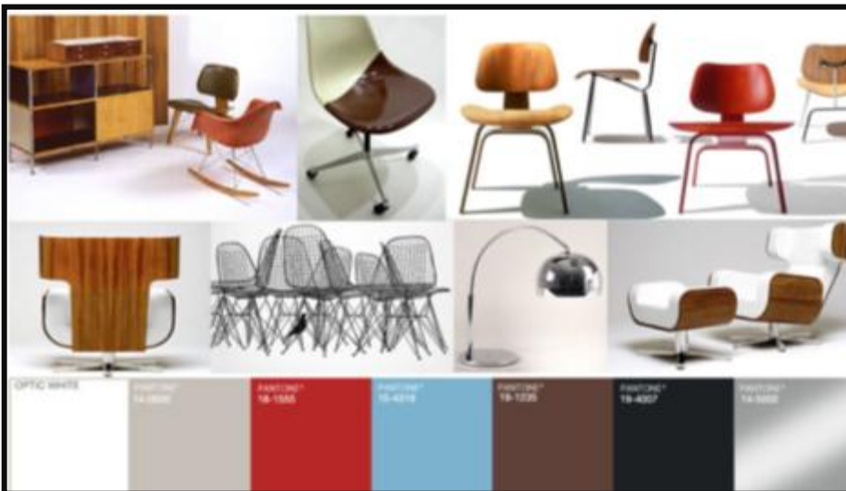
Minimalistinen väripaletti, skandinaavisuus, valkoinen, puusävyt nyt erityisesti tammi, ja tehosteväreinä ripaus punaista, mustaa ruskeaa Trendiin liittyvät selkeys ja laadukas muotoilu, klassikot